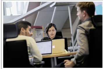
Volkswagen Digital Lab Berlin.