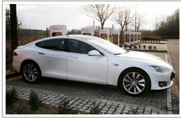
Tesla Model S.