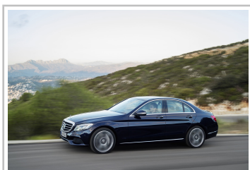
Mercedes-Benz C 300 Bluetec Hybrid.