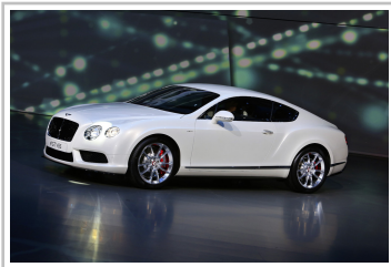
Bentley Continental GT V8 S.