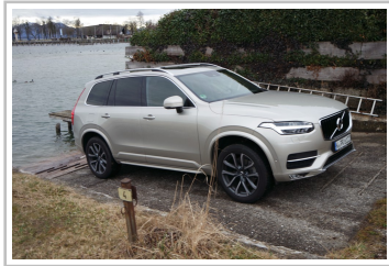
Volvo XC90 D5.