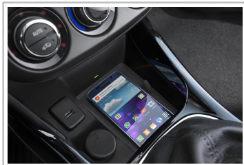
Induktives Laden eines Smartphones im Opel Adam.