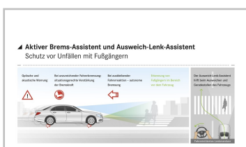
Aktiver Brems- und Ausweich-Lenk-Assistent von Mercedes-Benz.