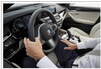
BMW-Autobahnassistent mit automatischem Spurwechsel.