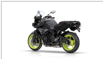
Yamaha MT-10 Tourer Edition.