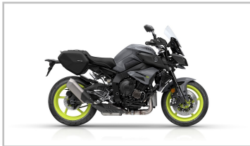
Yamaha MT-10 Tourer Edition.