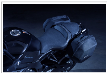
Yamaha MT-10 Tourer Edition.