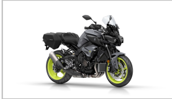
Yamaha MT-10 Tourer Edition.