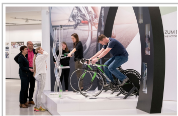
What drives You? - Skoda Unter den Linden.