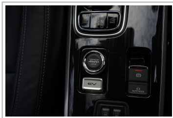
Mitsubishi Plug-in Hybrid Outlander.