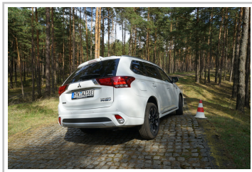
Mitsubishi Plug-in Hybrid Outlander.