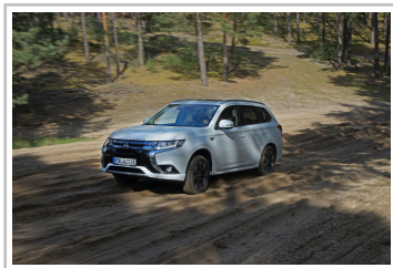
Mitsubishi Plug-in Hybrid Outlander.