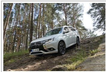
Mitsubishi Plug-in Hybrid Outlander.