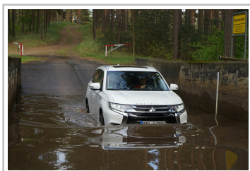
Mitsubishi Plug-in Hybrid Outlander.