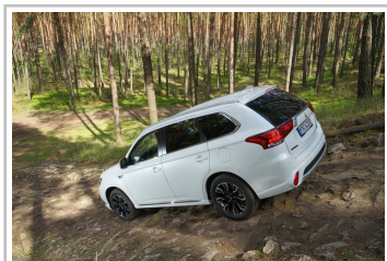
Mitsubishi Plug-in Hybrid Outlander.