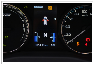
Mitsubishi Plug-in Hybrid Outlander.