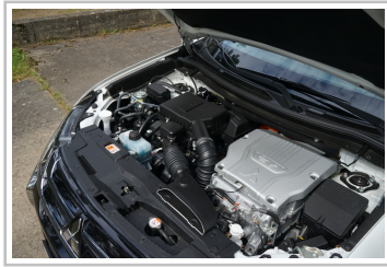
Mitsubishi Plug-in Hybrid Outlander.