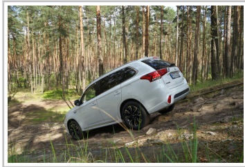
Mitsubishi Plug-in Hybrid Outlander.