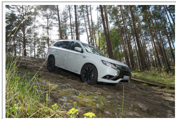
Mitsubishi Plug-in Hybrid Outlander.