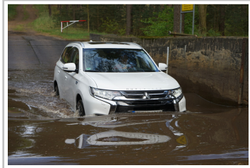
Mitsubishi Plug-in Hybrid Outlander.