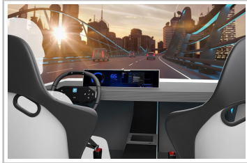
ZF Center Cockpit Concept.