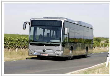
Mercedes-Benz Citaro LEÜ.