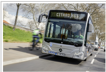
Mercedes-Benz Citaro NGT.