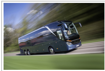
Setra Topclass 500.