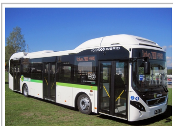
Volvo 7900 H.