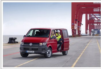
Volkswagen Transporter Kastenwagen Plus.