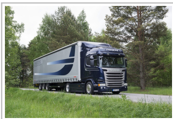
Scania G 410.