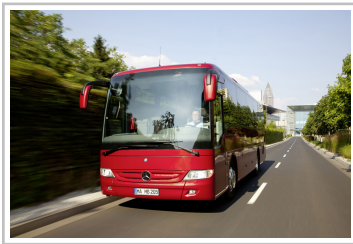
Mercedes-Benz Tourismo K.