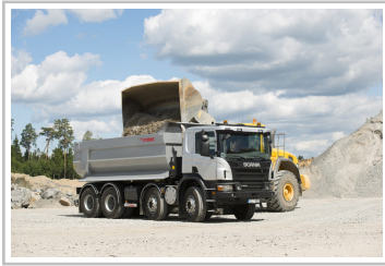
Scania P 400.