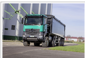
Mercedes-Benz Arocs 2051 AK 4x4.