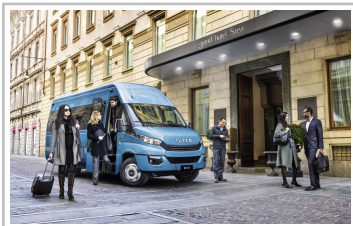
Iveco Daily Tourys.