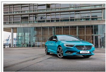
Opel Insignia Exclusive.