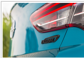
Opel Insignia Exclusive.