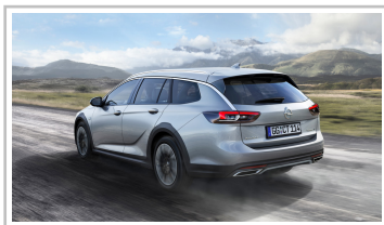
Opel Insignia Country Tourer.