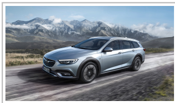
Opel Insignia Country Tourer.