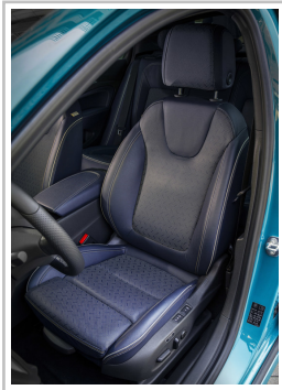
Opel Insignia Exclusive.