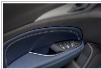
Opel Insignia Exclusive.