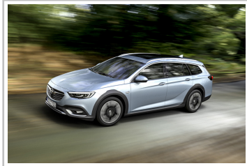
Opel Insignia Country Tourer.