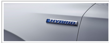
Honda CR-V Hybrid Prototype.