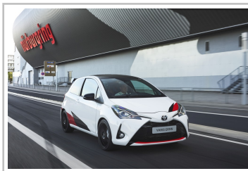
Toyota Yaris GRMN.