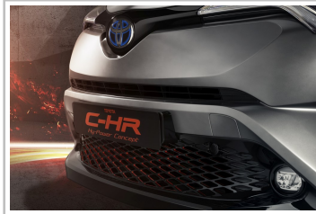
Toyota C-HR Hy-Power.