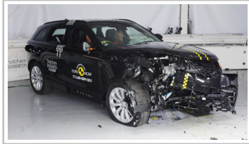
Range Rover Velar im Euro-NCAP-Crashtest.