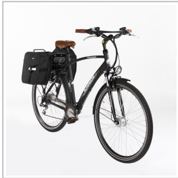
ADAC Pedelec Test: Ruhrwerk - 28" E-Bike.