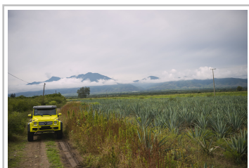
Mercedes-Benz G 500.