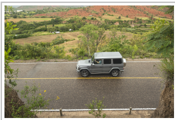
Mercedes-Benz G 500.