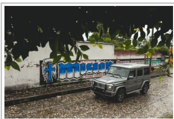
Mercedes-Benz G 500.