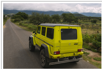
Mercedes-Benz G 500.