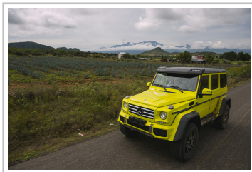
Mercedes-Benz G 500.