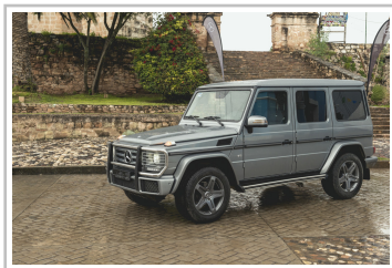
Mercedes-Benz G 500.