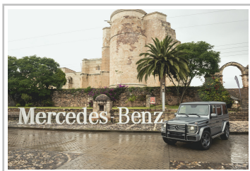
Mercedes-Benz G 500.