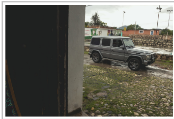
Mercedes-Benz G 500.