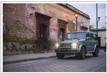
Mercedes-Benz G 500.