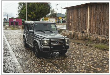
Mercedes-Benz G 500.