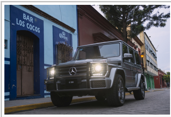
Mercedes-Benz G 500.