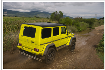
Mercedes-Benz G 500.