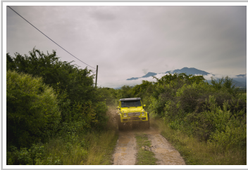
Mercedes-Benz G 500.