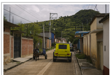
Mercedes-Benz G 500.