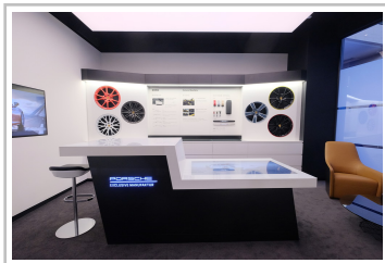
Porsche-Studio in Guangzhou.