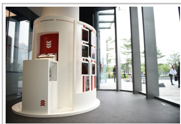
Porsche-Studio in Guangzhou.