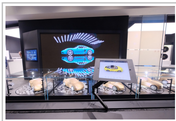
Porsche-Studio in Guangzhou.