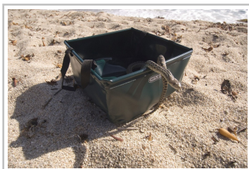
Faltschüssel von Ortlieb.