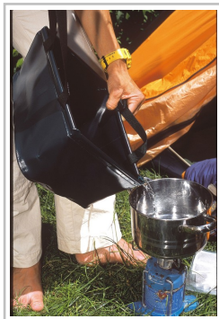
Faltschüssel von Ortlieb.