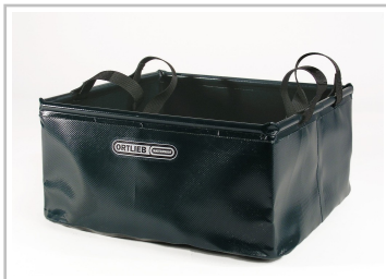
Faltschüssel von Ortlieb.