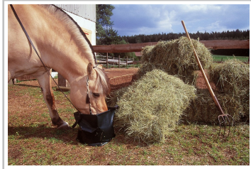
Faltschüssel von Ortlieb.