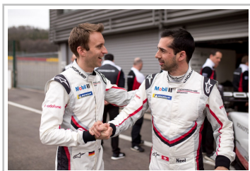
Porsche 919 Hybrid Evo vom Porsche LMP-Team: Neel Jani (rechts) und Timo Bernhard.