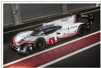
Porsche 919 Hybrid Evo vom Porsche LMP-Team.