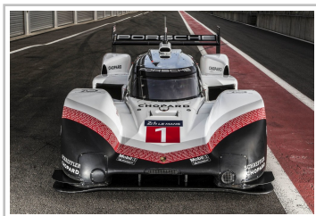
Porsche 919 Hybrid Evo vom Porsche LMP-Team.