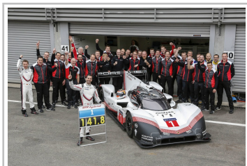
Porsche 919 Hybrid Evo vom Porsche LMP-Team.