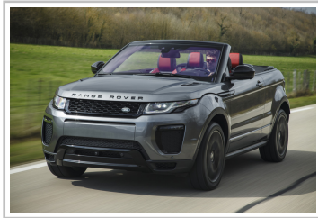
Range Rover Evoque Cabriolet.