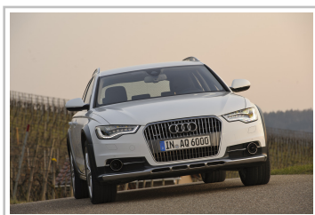
Audi A6 Allroad Quattro.