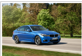
BMW 3er Gran Turismo M Sport.