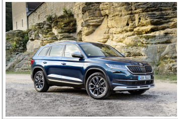
Skoda Kodiaq Scout.