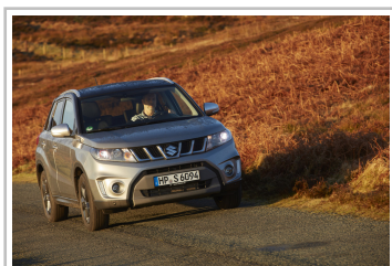
Suzuki Vitara S.