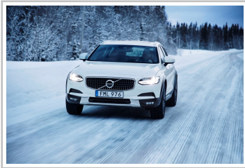
Volvo V90 Cross Country.