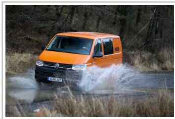
Volkswagen T6 Rockton.