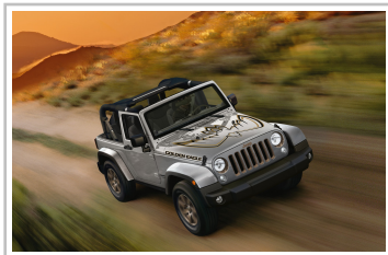
Jeep Wrangler Golden Eagle.