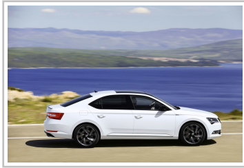
Skoda Superb Sportline.