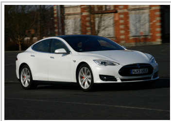
Tesla Model S.