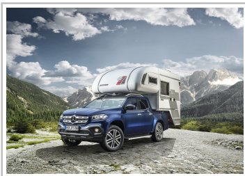
Mercedes-Benz X-Klasse mit Tisch-Absetzabine.