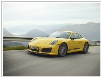
Porsche 911 Carrera T.