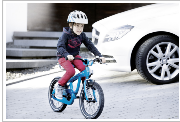
Mercedes-Benz Kidsbike und Kinder-Fahrradhelm.