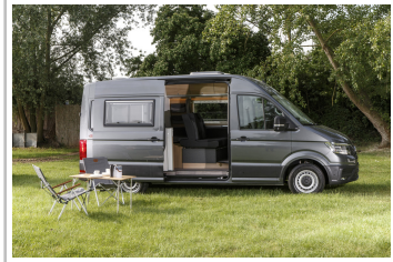
VW Crafter mit Reimo-Ausbau.