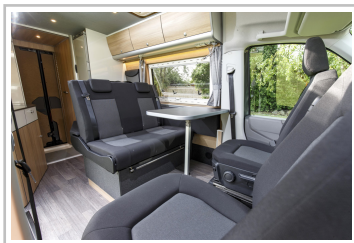
VW Crafter mit Reimo-Ausbau.