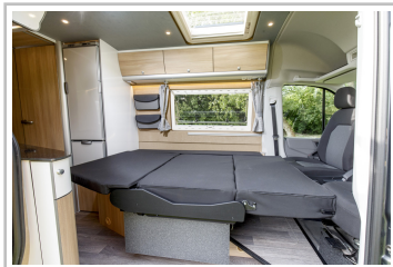
VW Crafter mit Reimo-Ausbau.