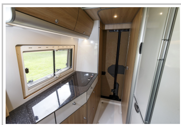
VW Crafter mit Reimo-Ausbau.