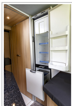
VW Crafter mit Reimo-Ausbau.