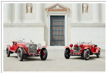
Mille Miglia 2018.