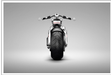
Curtiss Zeus Concept.