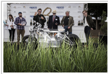
Enthüllung des Prototyps der Curtiss Zeus.