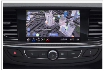
Multimedia Navi Pro im Opel Insignia.