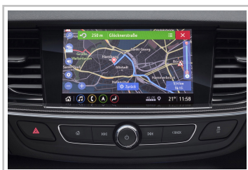
Multimedia Navi Pro im Opel Insignia.