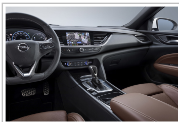
Infotainmentsystem Multimedia Navi Pro im Opel Insignia.