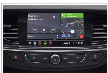
Infotainmentsystem im Opel Insignia.