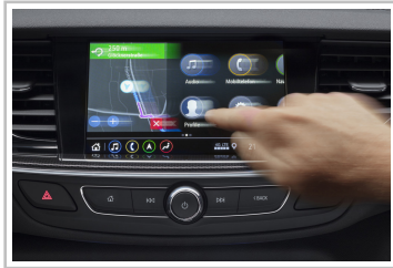
Infotainmentsystem im Opel Insignia.