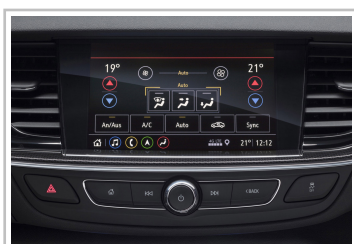
Infotainmentsystem im Opel Insignia.