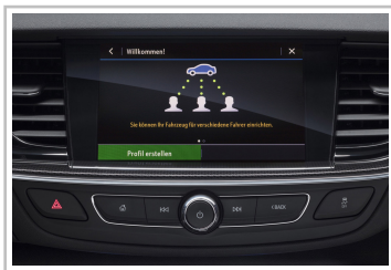
Infotainmentsystem im Opel Insignia.