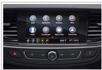
Infotainmentsystem im Opel Insignia.