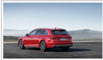
Audi A4 Avant S Line Competition.