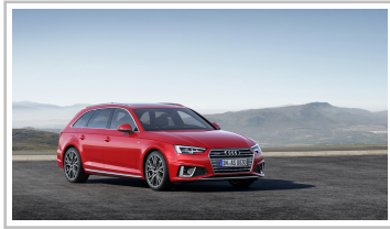
Audi A4 Avant S Line Competition.