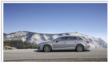
Audi A4 Avant.