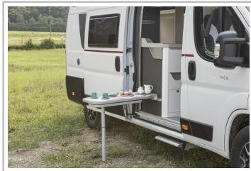
Roller Team Livingstone Duo.