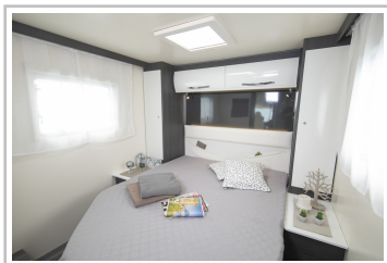
Roller Team Kronos Integriert 265.