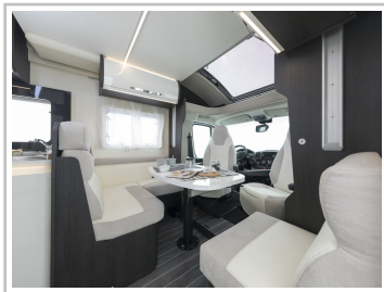
Roller Team Kronos 284 TL.