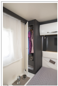
Roller Team Kronos Integriert 265.