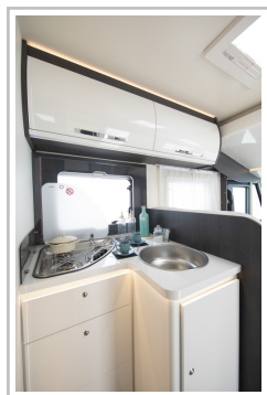
Roller Team Kronos Integriert 265.