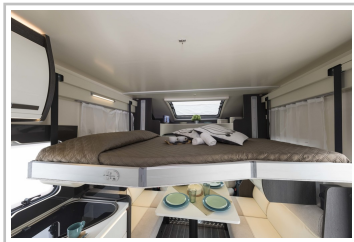
Roller Team Kronos 267 TL.