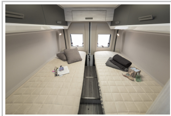
Roller Team Livingstone Duo.