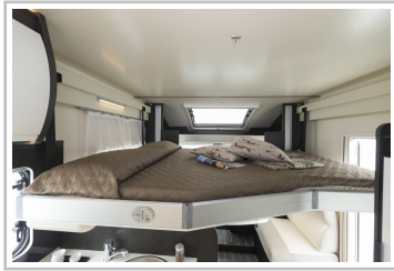
Roller Team Kronos 284 TL.