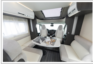
Roller Team Kronos 284 TL.