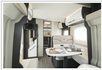
Roller Team Kronos 284 TL.