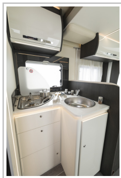
Roller Team Kronos 284 TL.