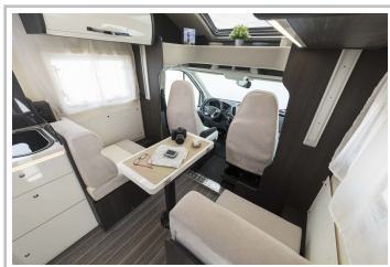
Roller Team Kronos 267 TL.