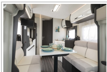
Roller Team Kronos 267 TL.