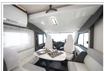
Roller Team Kronos Integriert 265.