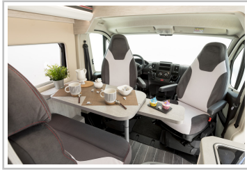
Roller Team Livingstone Duo.