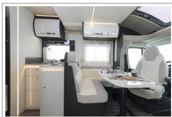
Roller Team Kronos 284 TL.