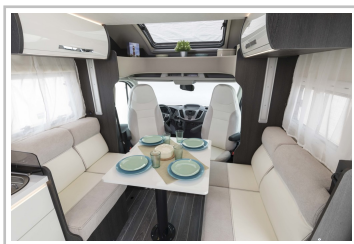
Roller Team Kronos 267 TL.