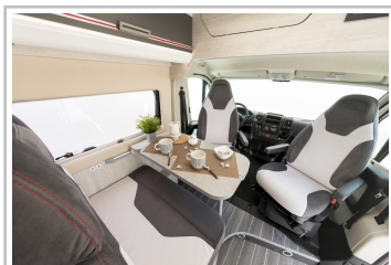
Roller Team Livingstone Duo.