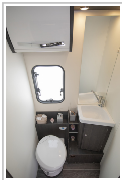
Roller Team Kronos Integriert 265.