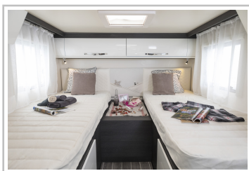
Roller Team Kronos 284 TL.