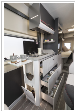
Roller Team Livingstone Duo.