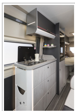
Roller Team Livingstone Duo.