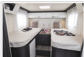
Roller Team Kronos 284 TL.