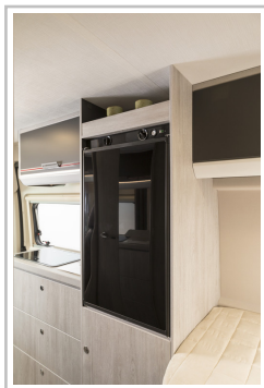
Roller Team Livingstone Duo.