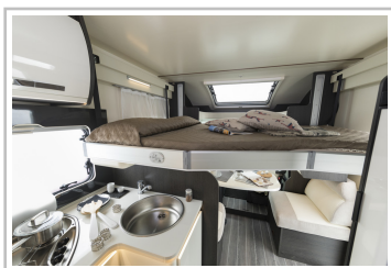
Roller Team Kronos 284 TL.