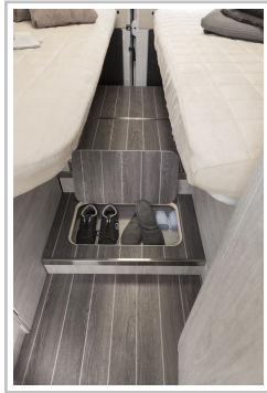
Roller Team Livingstone Duo.