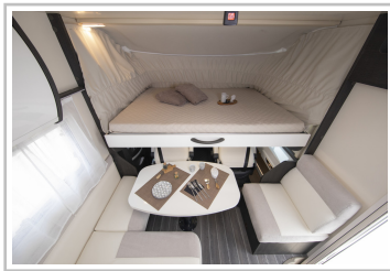
Roller Team Kronos Integriert 265.