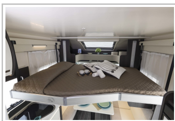
Roller Team Kronos 267 TL.