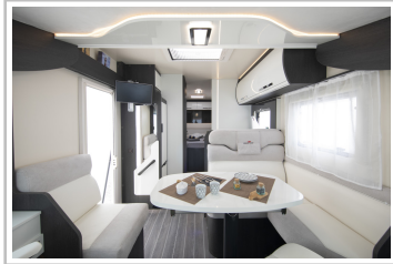
Roller Team Kronos Integriert 265.