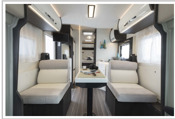
Roller Team Kronos 267 TL.