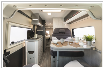
Roller Team Livingstone Duo.