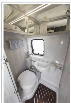
Roller Team Livingstone Duo.