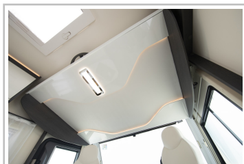
Roller Team Kronos Integriert 265.