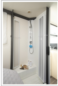
Roller Team Kronos Integriert 265.