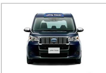
Toyota JPN Taxi.