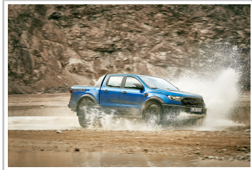
Ford Ranger Raptor.