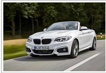
BMW 2er Cabrio.