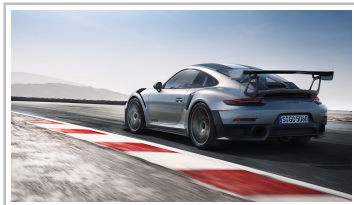
Porsche 911 GT2 RS.