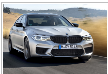
BMW M5 Competition.