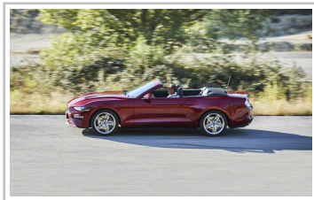
Ford Mustang Convertible 2.3.