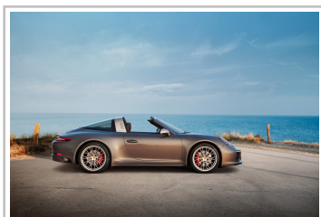
Porsche 911 Targa 4 GTS Exclusive Edition.