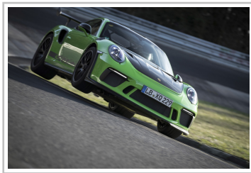
Porsche 911 GT3 RS auf der Nürburgring-Nordschleife.