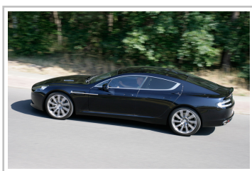
Aston Martin Rapide S.