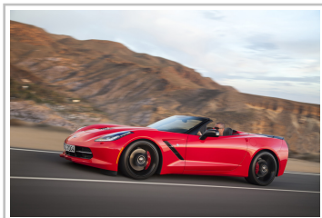
Chevrolet Corvette Stingray Convertible.