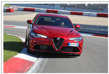
Alfa Romeo Giulia Quadrifoglio.