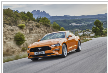
Ford Mustang GT 5.0.