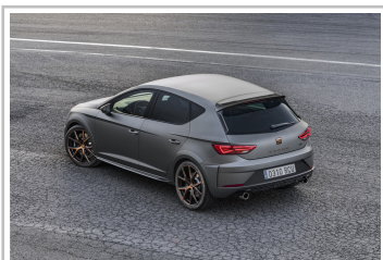
Seat Leon Cupra R.