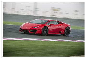
Lamborghini Huracan LP580-2.