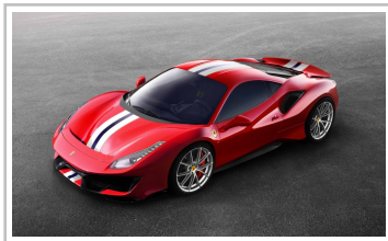
Ferrari 488 Pista.