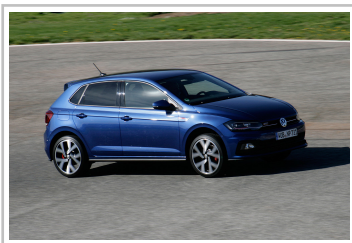
Volkswagen Polo GTI.