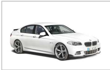
AC Schnitzer BMW 5er..