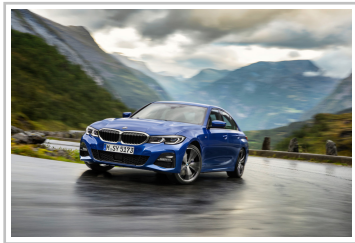
BMW 3er Limousine.