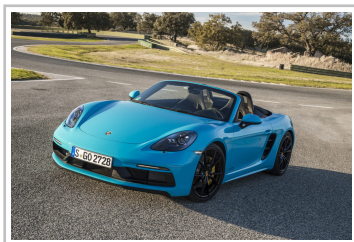
Porsche 718 Boxster GTS.