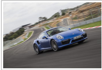
Porsche 911 Turbo.