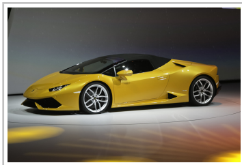
Lamborghini Huracan Spyder.