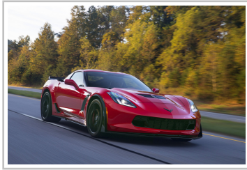
Chevrolet Corvette Z06.