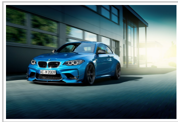
AC Schnitzer BMW M2.