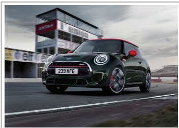
Mini John Cooper Works.