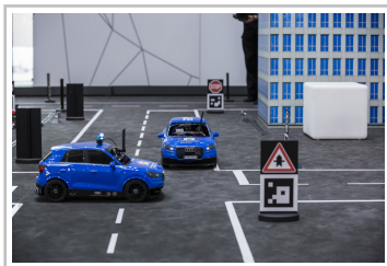
Audi Autonomous Driving Cup 2018.