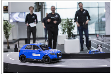
Audi Autonomous Driving Cup 2018.