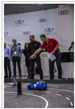
Audi Autonomous Driving Cup 2018.