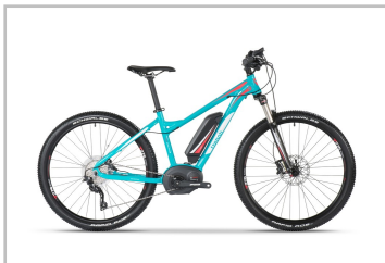
Trenoli Ruvido Lady 27,5.