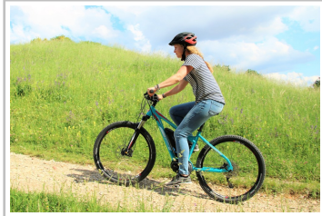
Trenoli Ruvido Lady 27,5.