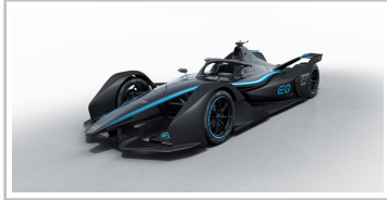
Mercedes-Benz EQ Formula E.