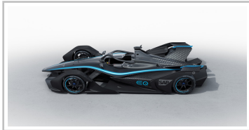
Mercedes-Benz EQ Formula E.