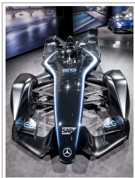
Mercedes-Benz EQ Formula E.