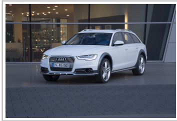
Audi A6 Allroad Quattro.