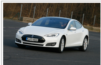
Tesla Model S.