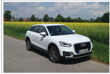
Audi Q2 1.0 TFSI.