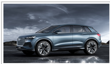
Audi Q4 e-tron concept.