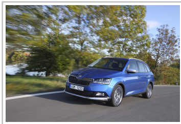
Skoda Fabia Combi Scoutline.