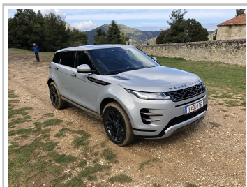
Range Rover Evoque.