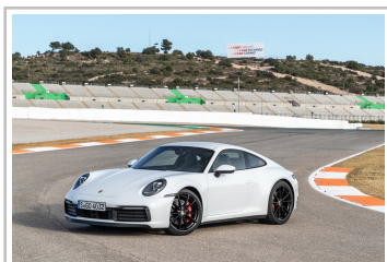
Porsche 911 Carrera S.