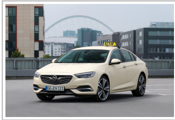
Opel Insignia Sports Tourer Taxi.