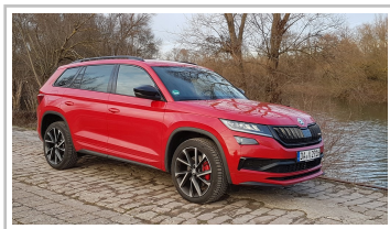
Skoda Kodiaq RS.