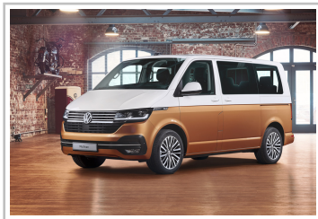
Volkswagen T6.1 Multivan.