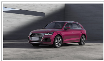
Audi Q5 L.