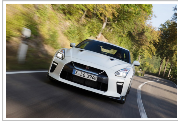
Nissan GT-R Track Edition.