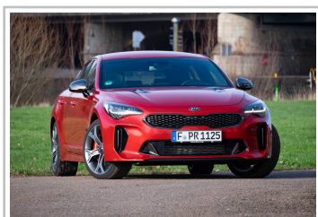
Kia Stinger GT.