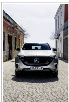
Mercedes-Benz EQC Edition 1886.