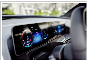
Mercedes-Benz EQC Edition 1886.