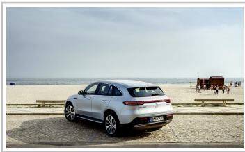
Mercedes-Benz EQC Edition 1886.