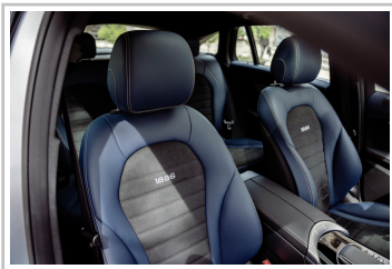
Mercedes-Benz EQC Edition 1886.