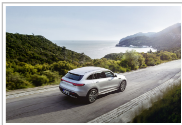
Mercedes-Benz EQC Edition 1886.