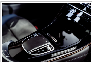
Mercedes-Benz EQC Edition 1886.