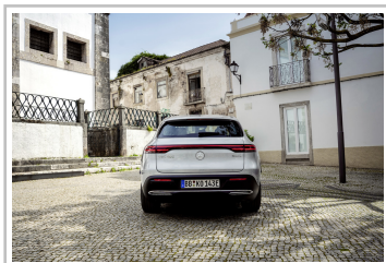
Mercedes-Benz EQC Edition 1886.