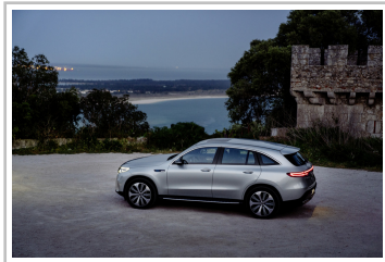
Mercedes-Benz EQC Edition 1886.