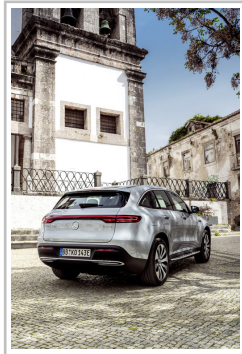
Mercedes-Benz EQC Edition 1886.