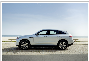
Mercedes-Benz EQC Edition 1886.