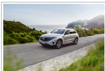
Mercedes-Benz EQC Edition 1886.