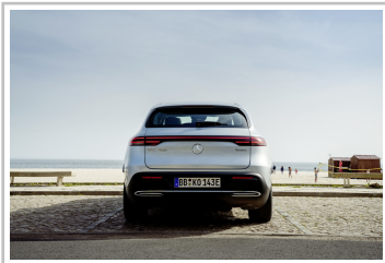
Mercedes-Benz EQC Edition 1886.