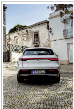
Mercedes-Benz EQC Edition 1886.