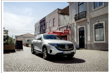
Mercedes-Benz EQC Edition 1886.