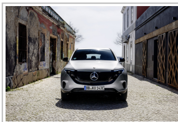
Mercedes-Benz EQC Edition 1886.