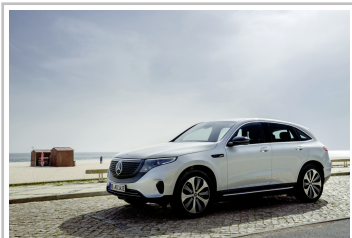
Mercedes-Benz EQC Edition 1886.