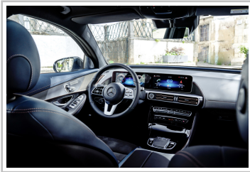
Mercedes-Benz EQC Edition 1886.