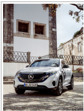
Mercedes-Benz EQC Edition 1886.