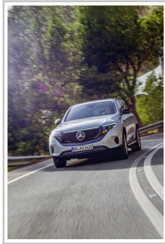
Mercedes-Benz EQC Edition 1886.