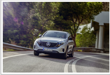
Mercedes-Benz EQC Edition 1886.