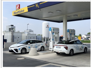
Toyota Mirai an der Wasserstoff-Tankstelle in Münster.