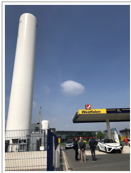
Toyota Mirai an der Wasserstoff-Tankstelle in Münster.