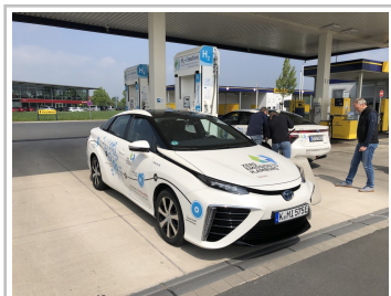
Toyota Mirai an der Wasserstoff-Tankstelle in Münster.