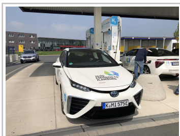
Toyota Mirai an der Wasserstoff-Tankstelle in Münster.