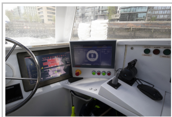
Forschungskatamaran "Energy Observer" in Hamburg.