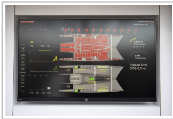
Forschungskatamaran "Energy Observer" in Hamburg.