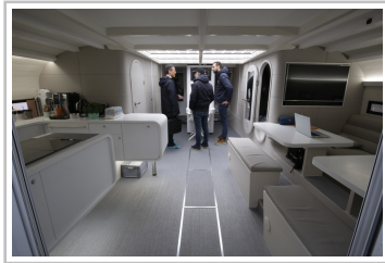
Forschungskatamaran "Energy Observer" in Hamburg.