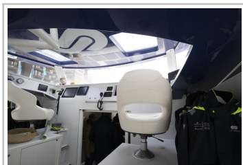
Forschungskatamaran "Energy Observer" in Hamburg.