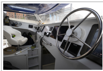
Forschungskatamaran "Energy Observer" in Hamburg.