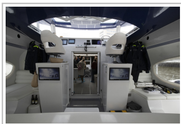
Forschungskatamaran "Energy Observer" in Hamburg.