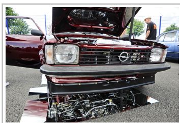
Opel Kadett C beim Opel-Treffen in Oschersleben.