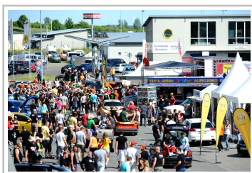
Opel-Treffen in Oschersleben.