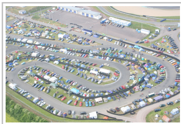
Opel-Treffen in Oschersleben.