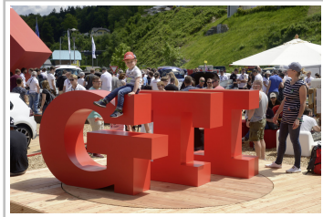
GTI-Treffen am Wörthersee.