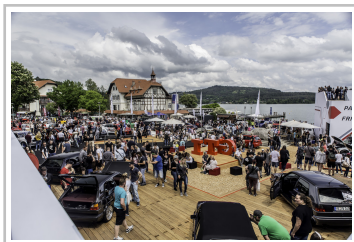
GTI-Treffen am Wörthersee.