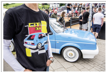
GTI-Treffen am Wörthersee.