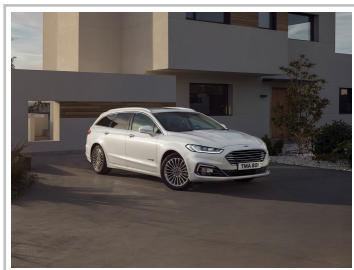
Ford Mondeo Turnier Hybrid.