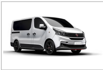
Fiat Talento Sportivo.