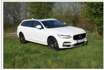
Volvo V90 Cross Country.