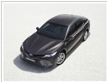
Toyota Camry Hybrid.