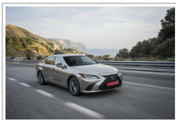
Lexus ES 300h.