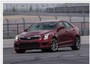
Cadillac ATS-V (2015).