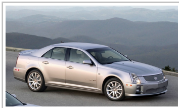
Cadillac STS-V (2004).