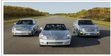
Cadillac XLR-V (2005).