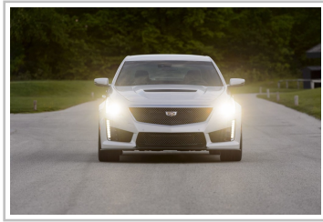
Cadillac ATS-V (2017).