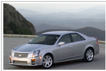
Cadillac CTS-V (2004).