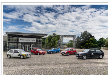
ADAC-Oldtimerfahrt Hessen-Thüringen 2019: Opel schickte fünf ältere Corsa auf die Strecke.