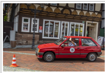
ADAC-Oldtimerfahrt Hessen-Thüringen: Opel Corsa A (1983).