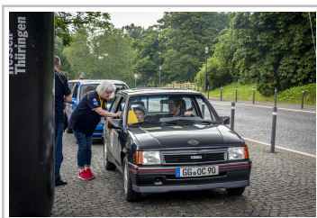
ADAC-Oldtimerfahrt Hessen-Thüringen 2019: Opel Corsa GSi.