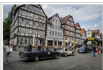
ADAC-Oldtimerfahrt Hessen-Thüringen 2019.