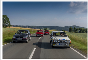
ADAC-Oldtimerfahrt Hessen-Thüringen 2019: Der Corsa-Tross von Opel.