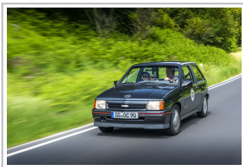
ADAC-Oldtimerfahrt Hessen-Thüringen 2019: Opel Corsa A GSi.