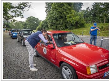
ADAC-Oldtimerfahrt Hessen-Thüringen 2019: Der Corsa-Tross von Opel.