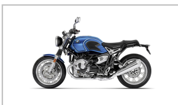
BMW R nineT /5.