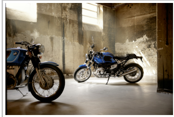
BMW R nineT /5.