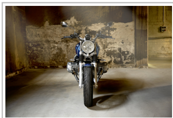
BMW R nineT /5.