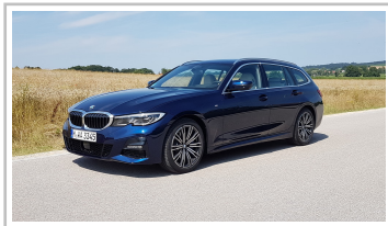
BMW 3er Touring.