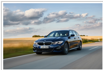
BMW 3er Touring.