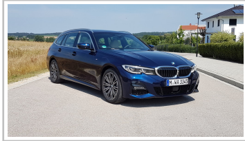
BMW 3er Touring.