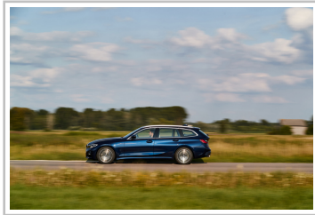
BMW 3er Touring.