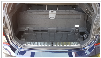
BMW 3er Touring.