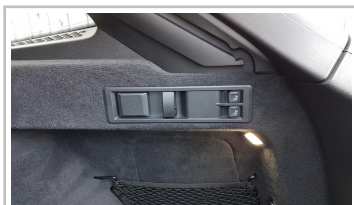
BMW 3er Touring.