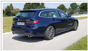
BMW 3er Touring.