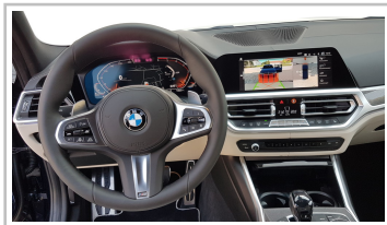
BMW 3er Touring.