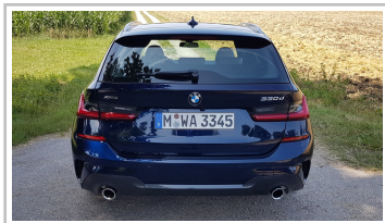
BMW 3er Touring.