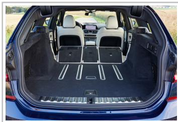
BMW 3er Touring.