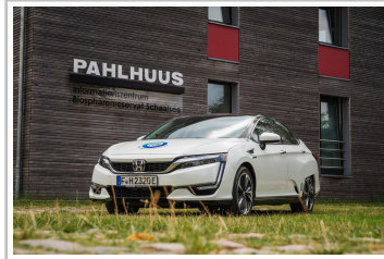
Honda Clarity Fuel Cell im UNESCO-Biosphärenreservat Schaalsee.