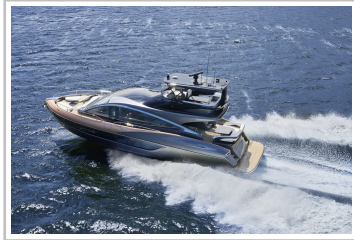
Lexus LY 650.