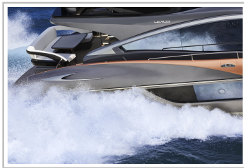
Lexus LY 650.