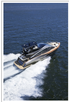
Lexus LY 650.