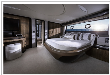
Lexus LY 650.