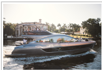
Lexus LY 650.