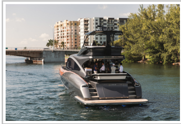
Lexus LY 650.