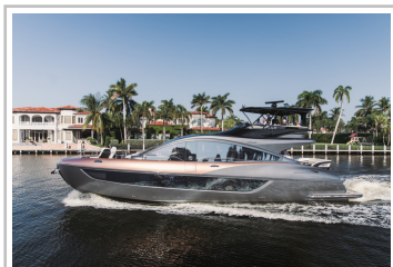
Lexus LY 650.