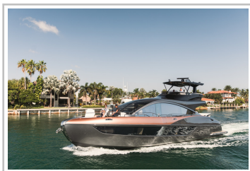
Lexus LY 650.