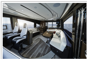
Lexus LY 650.