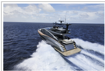
Lexus LY 650.