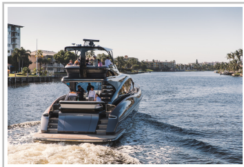
Lexus LY 650.