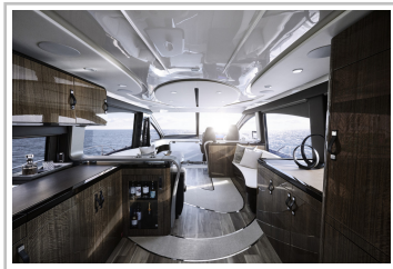
Lexus LY 650.