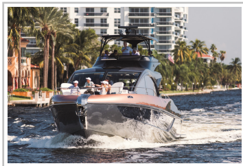
Lexus LY 650.