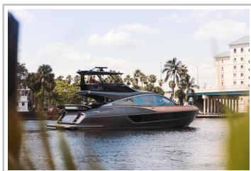
Lexus LY 650.