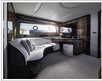
Lexus LY 650.