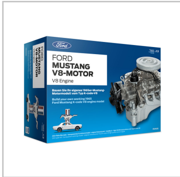
Franzis-Bausatz Mustang V8-Motor.