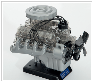
Franzis-Bausatz Mustang V8-Motor.