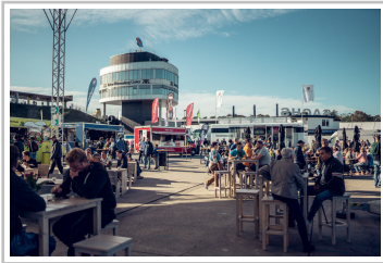
Porsche beim Sports-car-Together-Day 2019.