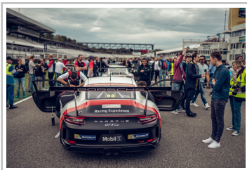
Porsche beim Sports-car-Together-Day 2019.