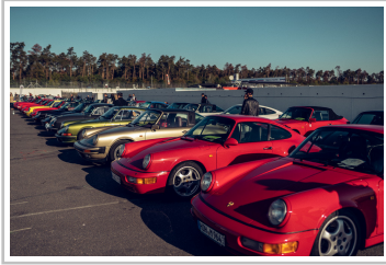
Porsche beim Sports-car-Together-Day 2019.