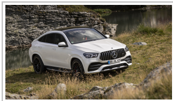
Mercedes-Benz GLE Coupé.