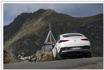
Mercedes-Benz GLE Coupé.