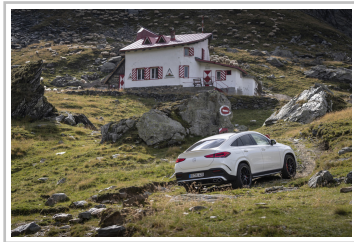
Mercedes-Benz GLE Coupé.