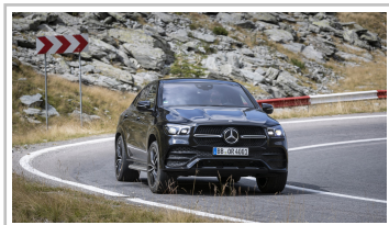
Mercedes-Benz GLE Coupé.