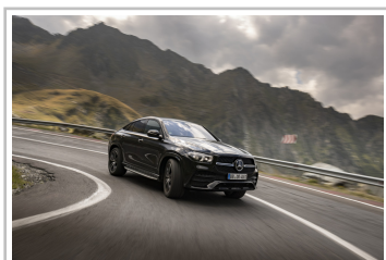
Mercedes-Benz GLE Coupé.