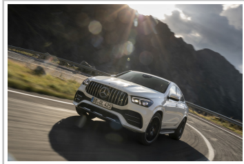
Mercedes-Benz GLE Coupé.