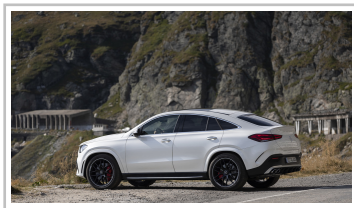
Mercedes-Benz GLE Coupé.