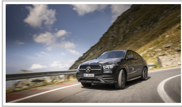
Mercedes-Benz GLE Coupé.