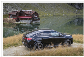
Mercedes-Benz GLE Coupé.