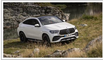
Mercedes-Benz GLE Coupé.