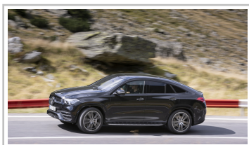
Mercedes-Benz GLE Coupé.