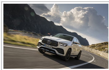
Mercedes-Benz GLE Coupé.