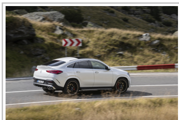
Mercedes-Benz GLE Coupé.