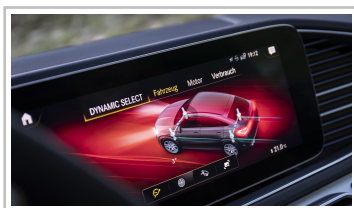
Mercedes-Benz GLE Coupé.