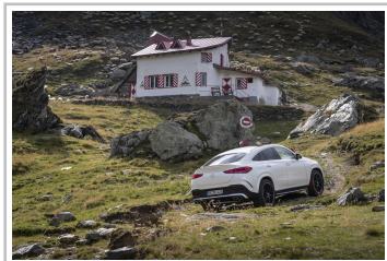
Mercedes-Benz GLE Coupé.