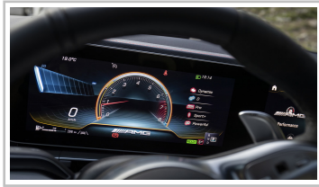
Mercedes-Benz GLE Coupé.