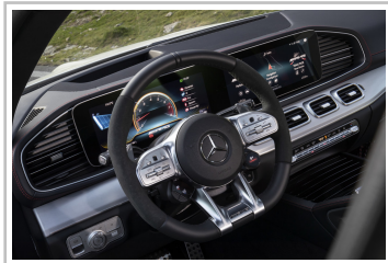
Mercedes-Benz GLE Coupé.