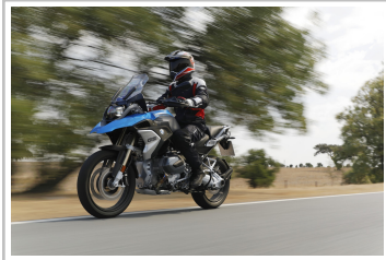
BMW R 1250 GS.