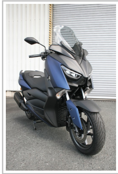
Yamaha X-Max 300.