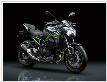
Kawasaki Z 900.