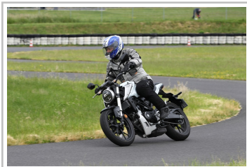
Honda CB 125 R.