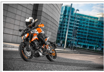
KTM 125 Duke.