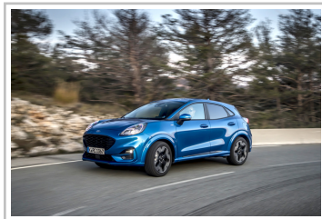
Ford Puma ST-Line.