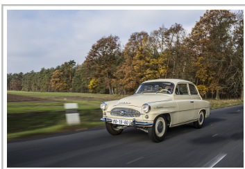
Skoda Octavia (1959–1964).