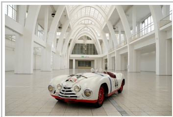
Skoda Sport (1950).