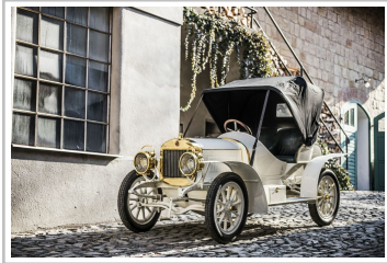
Laurin & Klement BSC von 1908.