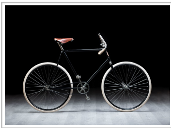
Funktionstüchtiger Nachbau des Slavia-Fahrrads von 1896.